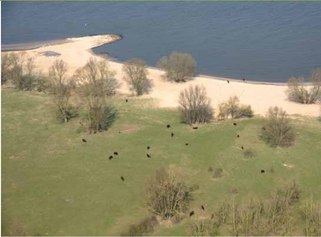
Millingerwaard. Het avontuur van de natuur in de directe nabijheid van eeuwenoude steden, heiligdommen en cultuurlandschappen. Dat hebben ze in de VS niet.

elders in Europa, waar handhaving een stuk minder ontwikkeld is en stroperspraktijken aan de orde van de dag zijn.